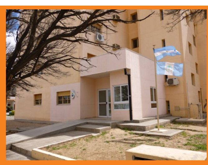
secretaría de Familia del Juzgado Civil N°1 de esa localidad.